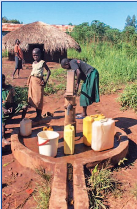
Lavori per la costruzione di un pozzo in Nord Uganda.

Sono anche stati acquistati degli attrezzi (zappe, machete, asce, falcetti) per facilitare la pulizia e la preparazione dei luoghi in cui si dovranno ricostruire le capanne. Altre attività svolte sono: il trasporto della gente dai campi, in modo particolare di bambini e casi particolarmente urgenti e gravi, fino all'ospedale di Gulu (30 Km e più) e il contributo alle spese medico-sanitarie dei più indigenti. I volontari seguono i malati in difficoltà nel processo di cura all'interno dell'ospedale fino al termine della degenza; l'acquisto e la distribuzione di utensili e strumenti per facilitare alle famiglie il ritorno ai villaggi di origine, ed in alcuni casi aiuto economico per la ricostruzione dei tetti pericolanti delle capanne rovinati dal tempo; le azioni di advocacy e pressione sulle autorità per il rispetto dei diritti umani, la ricerca di soluzioni pacifiche al conflitto e il ritorno nei villaggi d'origine della gente costretta a vivere all'interno dei campi.