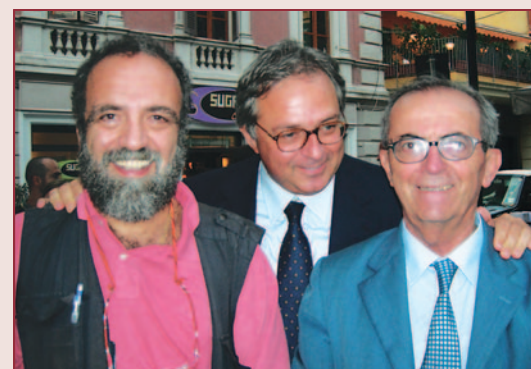
Fano, 6 ottobre 2007. Giobbe Covatta, Gianmario Spacca e Italo Nannini.

Grande è stata la partecipazione del pubblico, degli studenti in particolare, a tutte le iniziative e l'intera Settimana è stata una significativa occasione per accendere nuovamente i riflettori sul continente più oppresso e dimenticato.